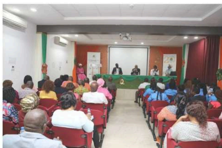
La salle de conférence du FIRCA a abrité la séance de sensibilisation sur le cancer du sein, le 22/10/2024

Abidjan, 22 oct 2024 (AIP) – Dans le cadre d'Octobre rose, marqué par un mois d'activités visant à prévenir ou lutter contre le cancer du