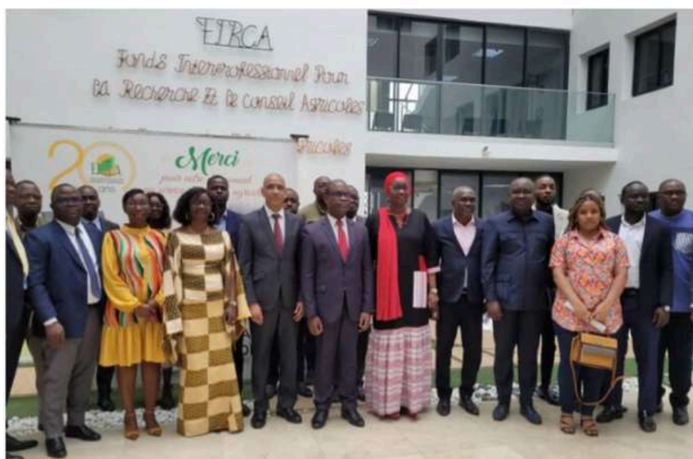
Lancement du READINESS, au FIRCA (Abidjan, 30/08/2024)

Scannez le QR Code pour regarder la vidéo