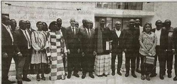
Le représentant du ministre de l'Environnement, du Développement durable et de la Transition écologique et les dirigeants du Firca se sont félicités du lancement du programme Readiness.

Soutenu par le Fonds vert pour le climat (Fvc), Readiness a pour objectif de mettre en place un cadre de planification, à long terme, pour des actions climatiques transformatrices en Côte d'Ivoire. Lors de la cérémonie, le directeur de cabinet a souligné l'importance de la collaboration avec le Firca, l'unique entité nationale accréditée par le Fvc, pour