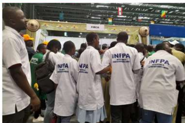
En quête d'informations, de nombreux apprenants de l'Institut national de formation professionnelle agricole (INFPA) prennent l'assaut le stand du FIRCA aux JNPCA (Abidjan, le 17/01/2025)