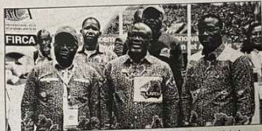
Les responsables du Firca ont démontré l'impact positif de leur Institution sur le monde agricole.