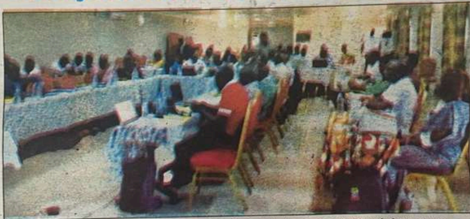
Les acteurs et partenaires de la filière hévéicole de Côte d'Ivoire se sont retrouvés à San Pedro à l'initiative de l'Apromac et du Firca.

La ville de San Pedro a abrité, du mardi 17 au vendredi 20 décembre 2024, la deuxième édition des " Journées de l'hévéa " (Jdh). Ces journées dédiées aux acteurs et partenaires de la filière hévéicole de Côte d'Ivoire ont été organisées par l'Association des professionnels du caoutchouc naturel de Côte d'Ivoire (Apromac) et le Fonds interprofessionnel pour la recherche et le conseil agricole (Firca). Cette édition de San Pedro a été ponctuée de plusieurs activités, entre autres, le bilan de l'assistance technique au titre de l'année 2024, l'actualisation des cahiers de charges, le bilan à mi-parcours du projet national de géoréférencement des planteurs d'hévéa, la mise en place des associations de valorisation de l'entraide communautaire pour les femmes des planteurs des groupes de vulgarisation de la filière hévéa, l'état des lieux de la recherche hévéicole en Côte d'Ivoire et des concours nationaux des meilleurs saigneurs, meilleurs moniteurs, meilleurs groupes de vulgarisation, meilleurs contrôleurs de sa-