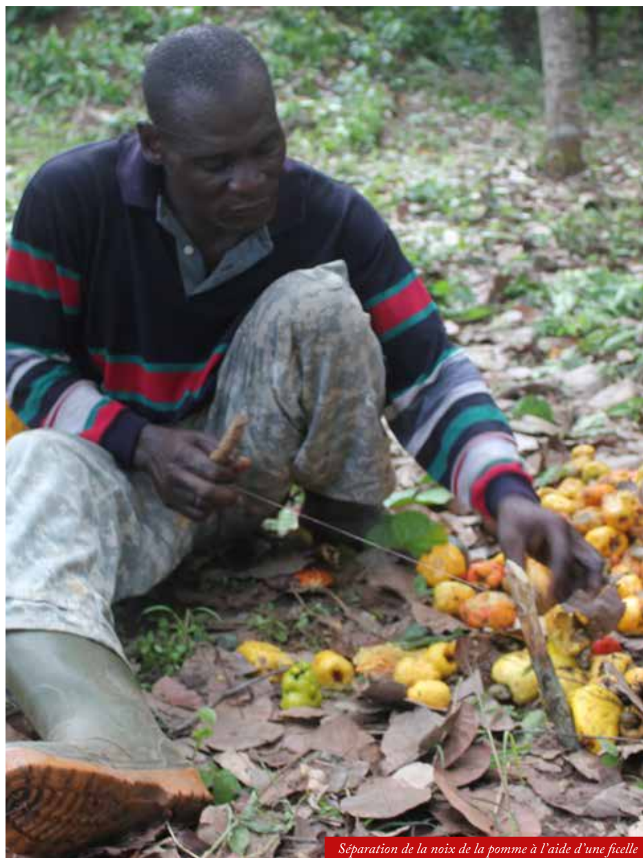
Séparation de la noix de la pomme à l'aide d'une ficelle