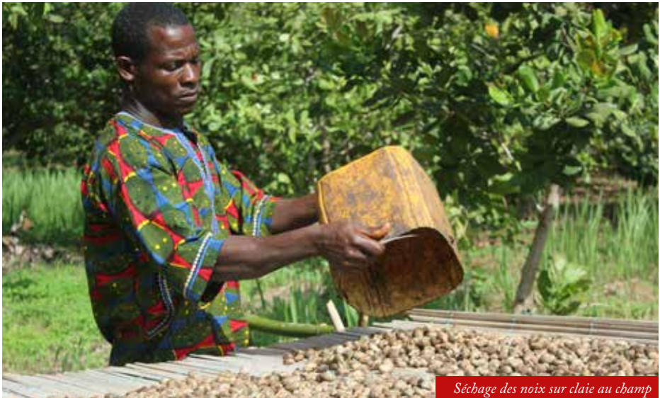
Séchage des noix sur claie au champ