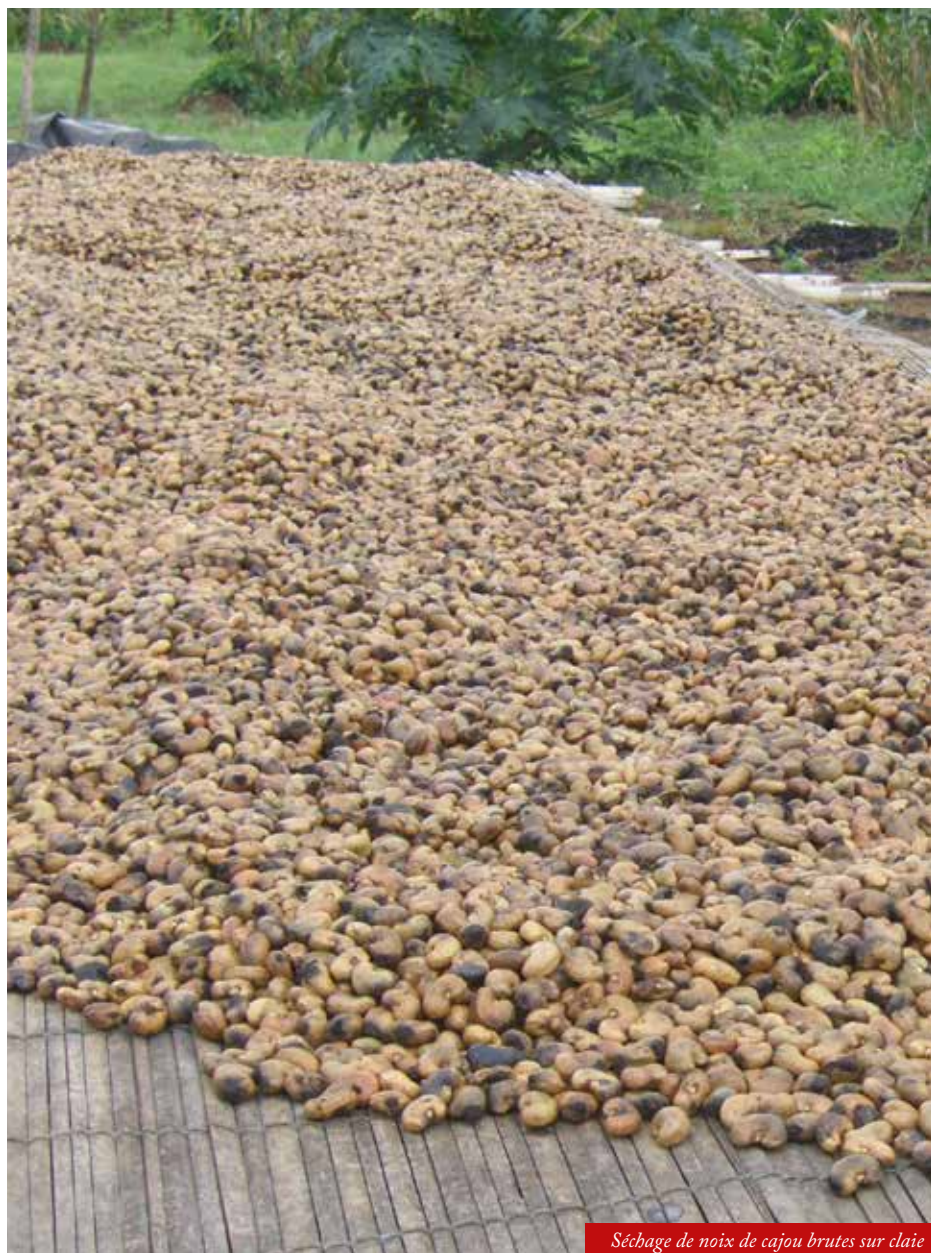
Séchage de noix de cajou brutes sur claie