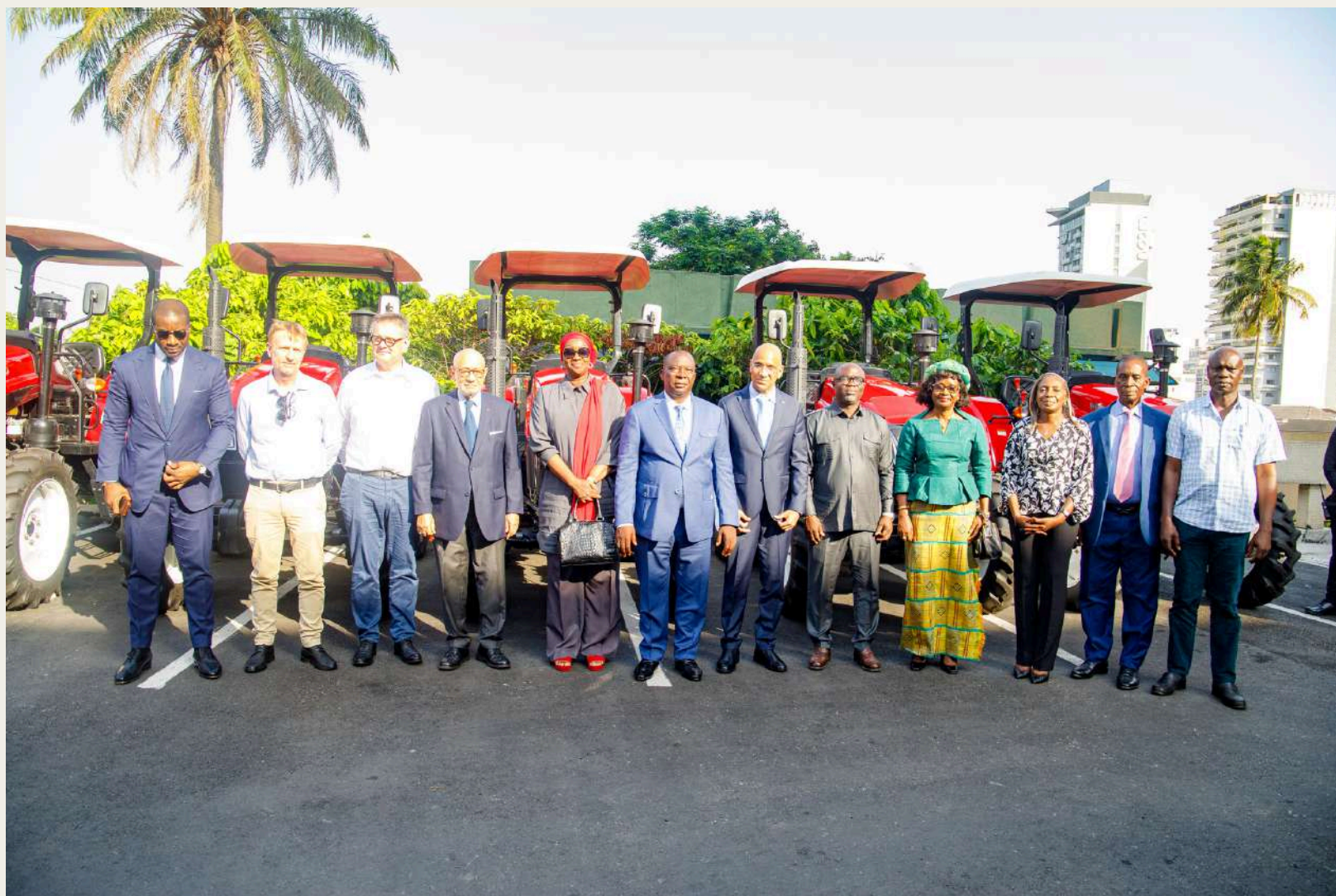
Photo de famille