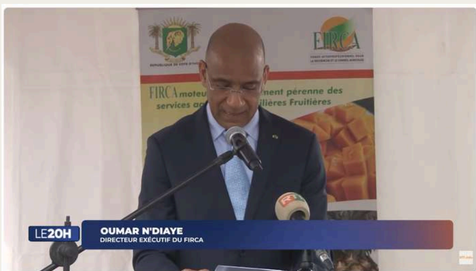
Le 20 Heures de RTI 1 du 20 décembre 2025 par Kolo Coulibaly