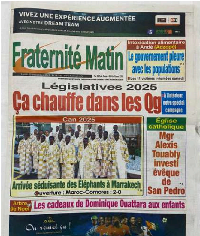
Publié dans le journal Fraternité Matin du 22 décembre 2025