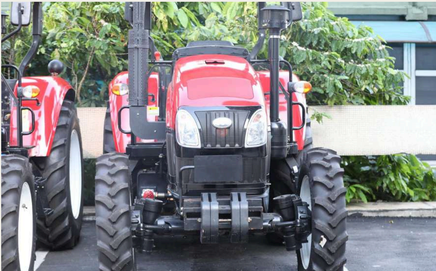
Photo de tracteurs