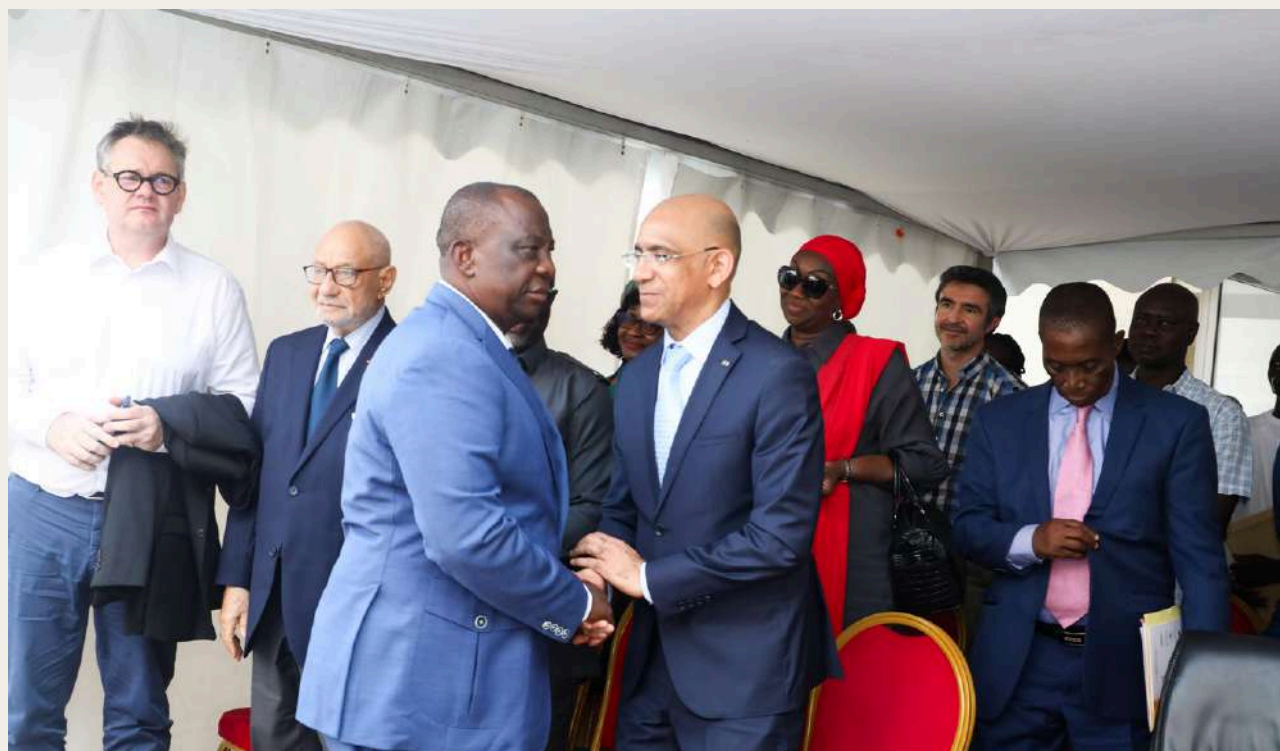
Le Ministre de tutelle (MEMINADERPV), saluant le Directeur Exécutif du FIRCA