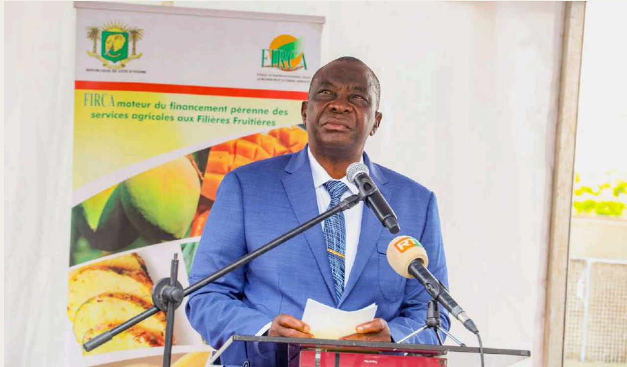
M. KOBENAN Kouassi Adjoumani Ministre d'État, Ministre de l'Agriculture du Développement Rural et des Productions Vivrières