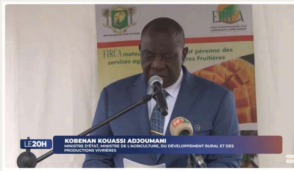
Le 20 Heures de RTI 1 du 20 décembre 2025 par Kolo Coulibaly