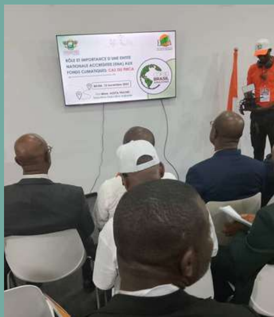
Vue de participants