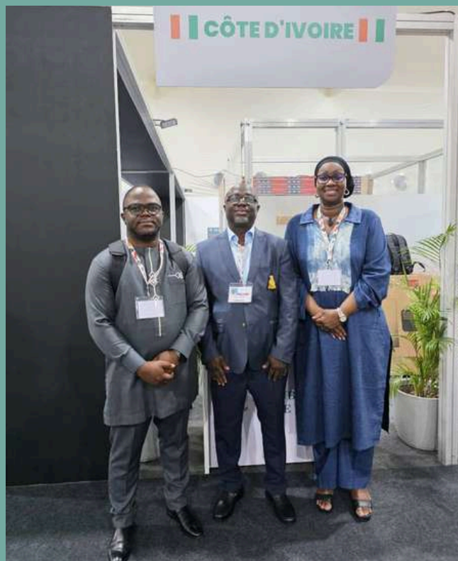
La délégation du FIRCA conduite par le PCA du FIRCA