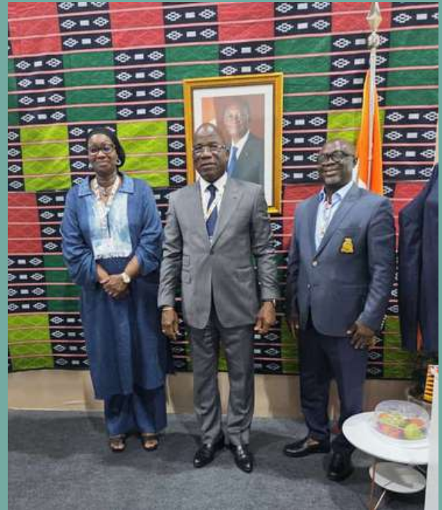
La délégation du FIRCA avec le Ministre de tutelle (MINEDDTE) à la COP 30