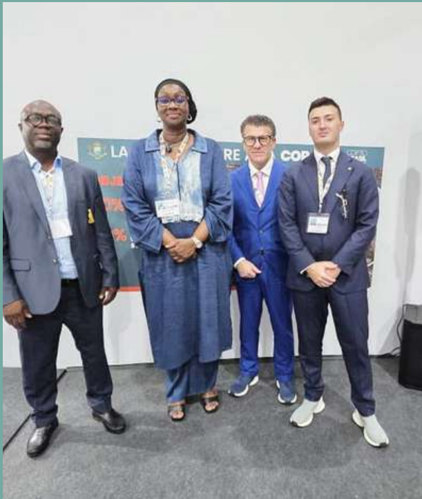
La délégation du FIRCA avec des participants à la COP 30