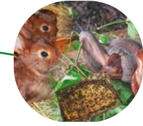
Élevage en développement