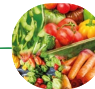
Légumes et Maraîchers