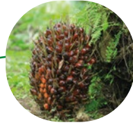
Palmier à huile