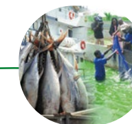
Pêche et aquaculture