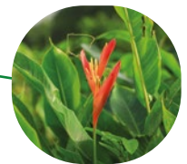
Fleurs & plantes ornementales