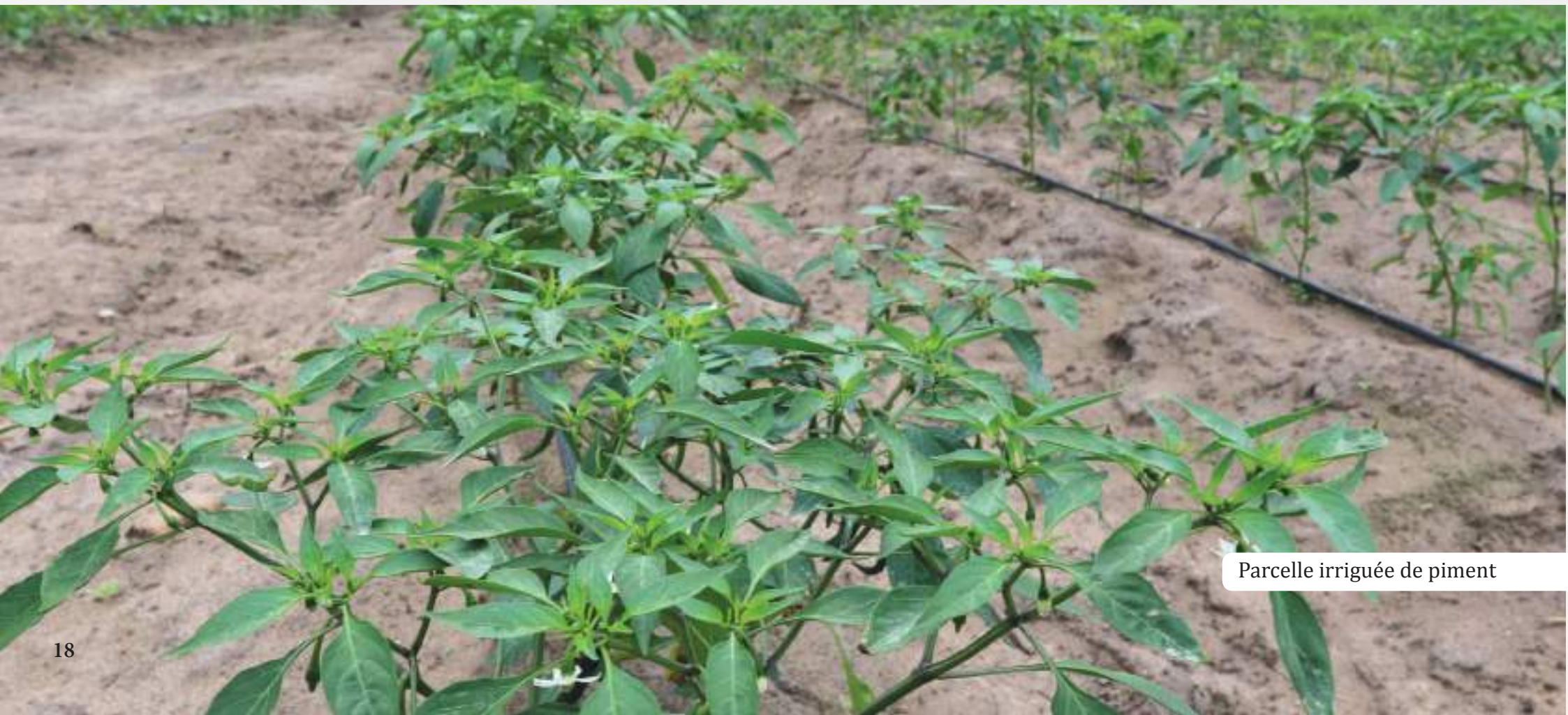
Parcelle irriguée de piment

La logique des interventions du Plan Opérationnel 2018-2020, suivant les axes du Plan Stratégique 2015-2020 dont il est issu, est synthétisée dans le tableau synoptique ci-dessous.