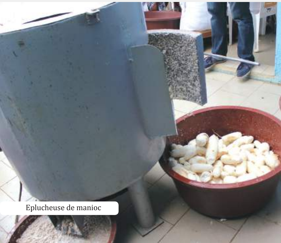
Eplucheuse de manioc