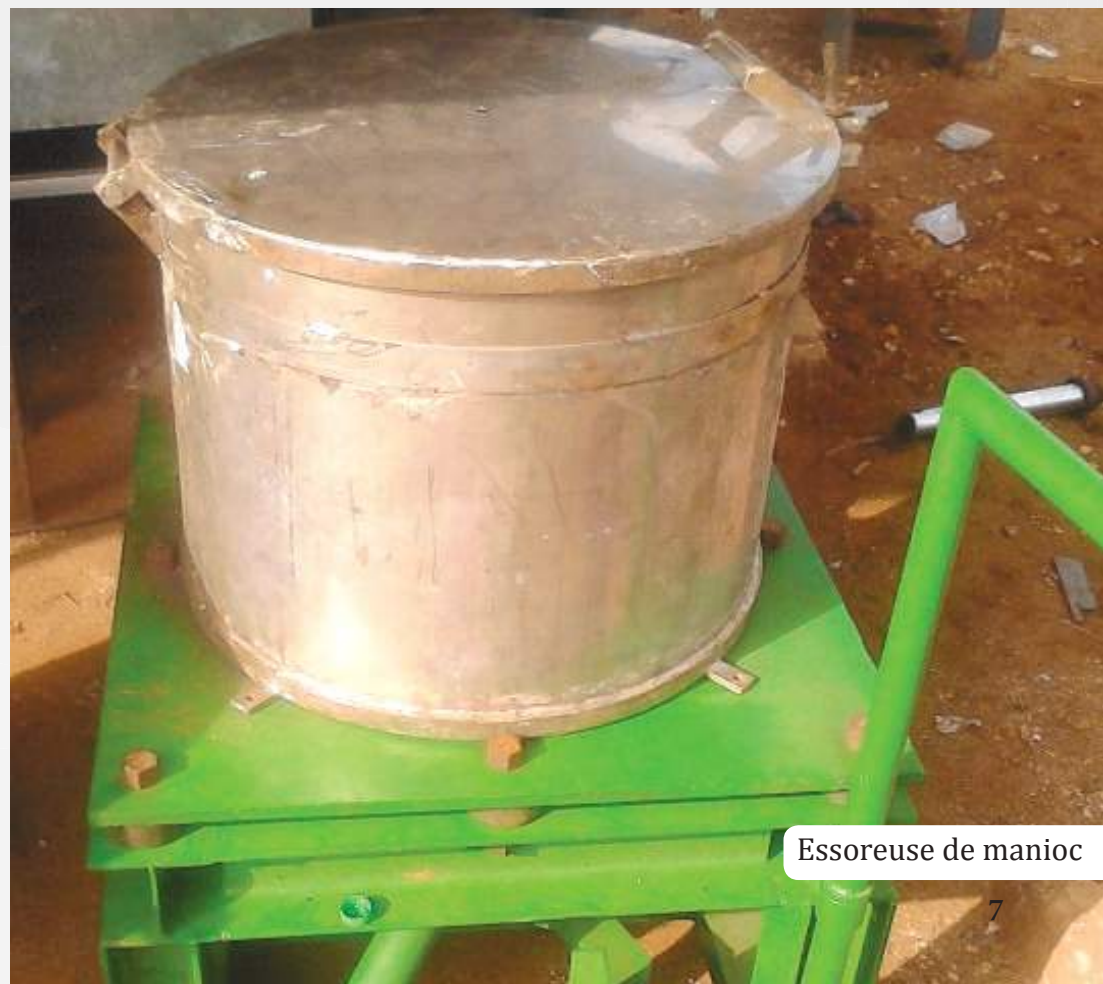
Essoreuse de manioc